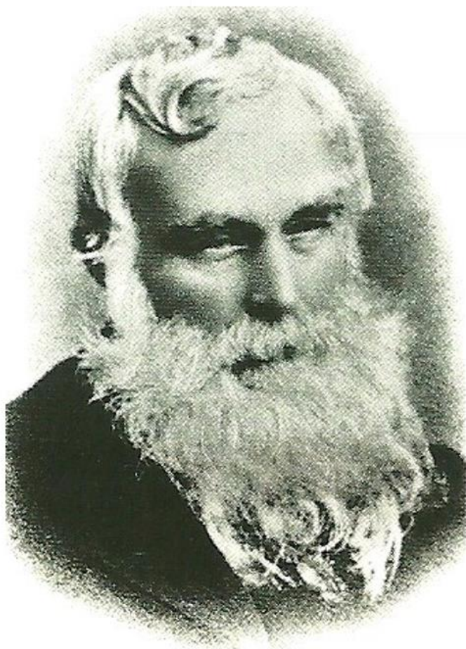
罗伯特·郭维德 (Robert Govett, 1813~1901)